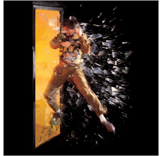
Art. 4952- Scheiben / Vitres / Sheets

All information and colour specifications are valid at the time of printing. For latest product details please see the respective online data sheet.