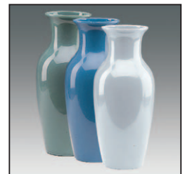
Art. 4951 16-