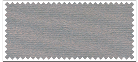
hellgrau / gris clair / light grey