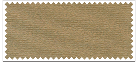
beige / beige / beige