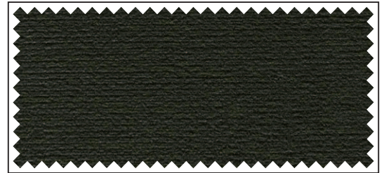
dunkelgrau / gris foncé / dark grey