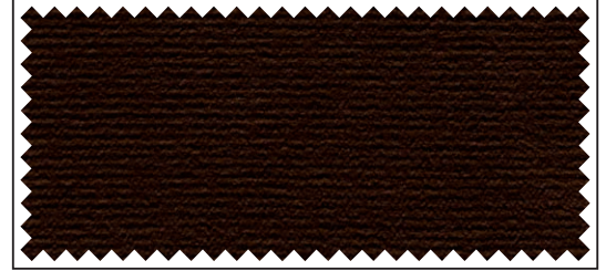
braun / brun / brown