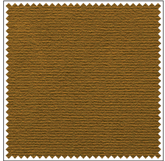
Griffmuster / Echantillon / Sample

Erläuterungen der Brandschutz- normen B1, M1, BS, EN, EN* und NFPA unter www.gerriets.com .