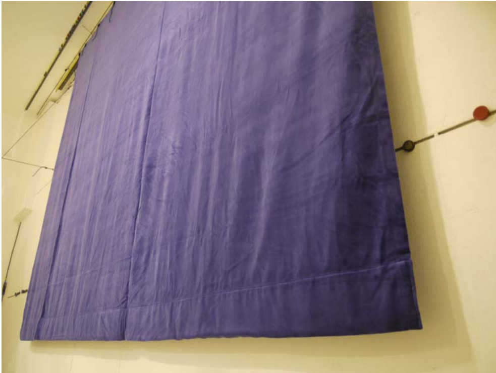
Foto B.1 Prüfaufbau im Hallraum – Vorhang ohne Faltenzugabe (Aufbau 1)