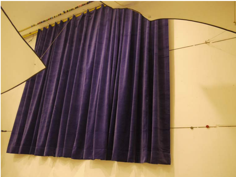
Foto B.2 Prüfaufbau im Hallraum – Vorhang mit Faltenzugabe (Aufbau 2)