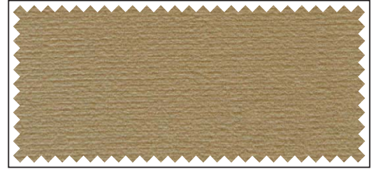
beige / beige / beige