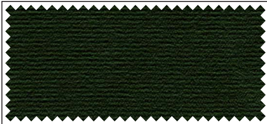
grün / vert / green