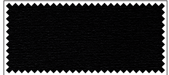
schwarz / noir / black