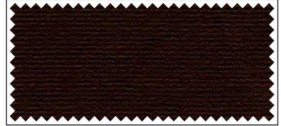
braun / brun / brown