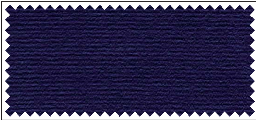
blau / bleu / blue