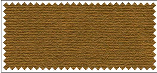
gold / or / gold