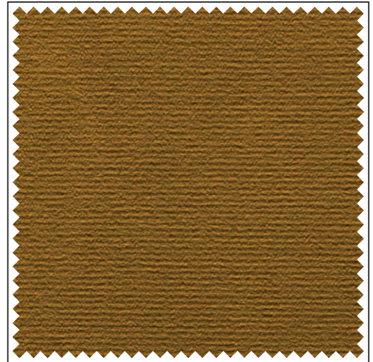
Griffmuster / Echantillon / Sample

Erläuterungen der Brandschutz- normen B1, M1, BS, EN, EN* und NFPA unter www.gerriets.com .