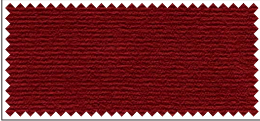
rot / rouge / red