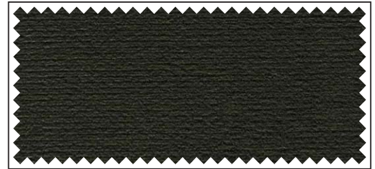
dunkelgrau / gris foncé / dark grey