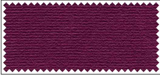
weinrot / bordeaux / wine red