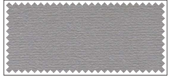
hellgrau / gris clair / light grey