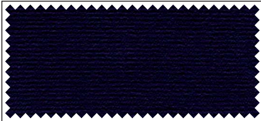
nachtblau / bleu nuit / night blue