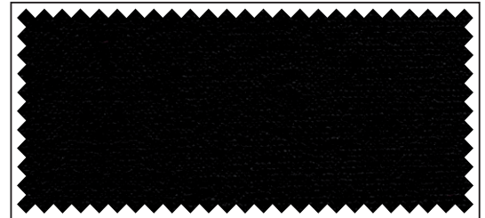
schwarz / noir / black