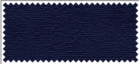
nachtblau / bleu nuit / night blue