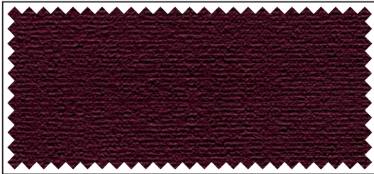
weinrot / bordeaux / wine red