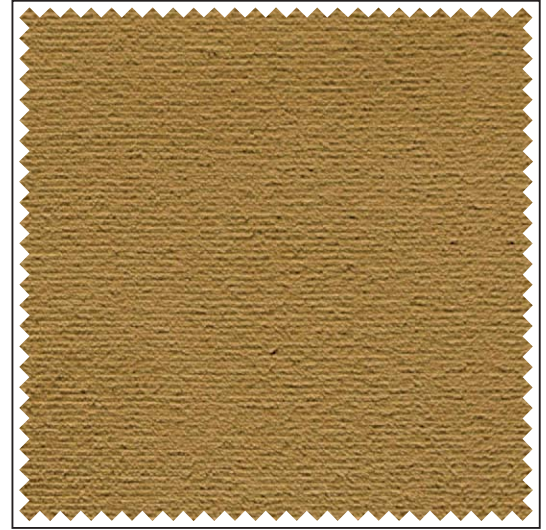
Griffmuster / Echantillon / Sample

100 % Cotton. Piece lengths approx. 54.7 yds. Minimum quantity for custom dyed colours approx. 437.5 yds. Acoustic values available.