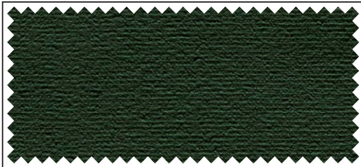
grün / vert / green