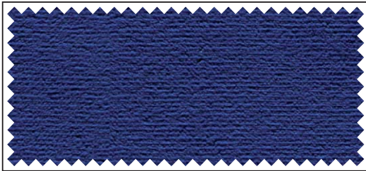
blau / bleu / blue