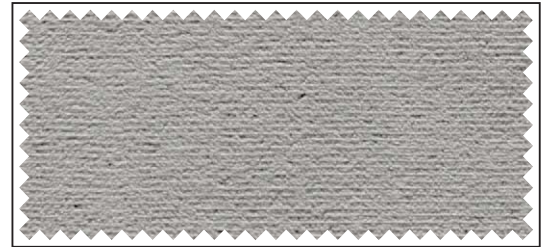
hellgrau / gris clair / light grey