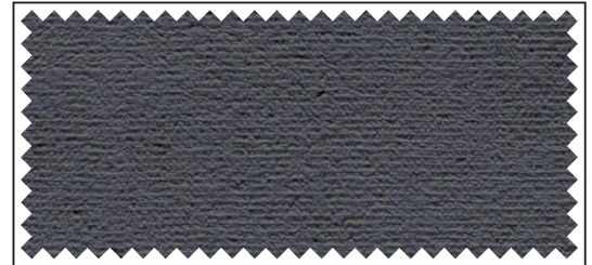
dunkelgrau / gris foncé / dark grey