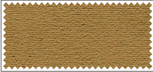
gold / or / gold