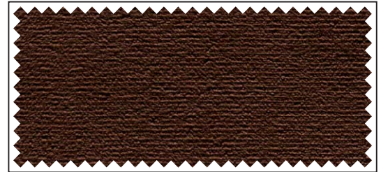
braun / brun / brown