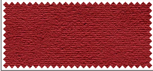
rot / rouge / red