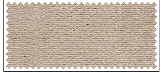
beige / beige / beige