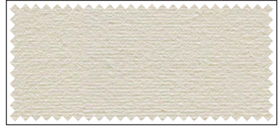
hellbeige / beige clair / light beige